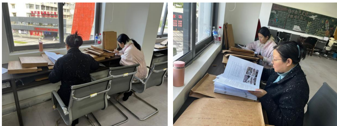
图2 认知实习和专业实习检查现场

本次2023-2024学年暑期认知实习、专业实习专项检查覆盖全院服装设计与工程专业7个班、纺织工程专业3个班和服装设计与工艺教育专业2个班的实习材料。从检查结果来看,学院各专业能依据教学计划要求,认真做好实习准备工作和实习材料归档工作。大部分教师的实习指导比较到位,大部分学生能够较好地完成实习任务,认真填写实习周记和报告。