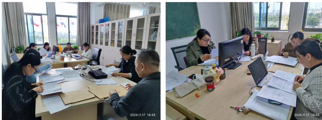
图4 试卷质量检查现场

本次试卷命题质量检查采用“全覆盖、双轮次”方式，在教研室自查的基础上，对本学期所有本科试卷进行全覆盖，重点对试卷的意识形态、题型、题量、难易度、应用型、重复率、规范性等进行检查。通过检查发现，本学期的命题质量有了进一步提高，整体命题水平和规范性程度都有了较大提升。