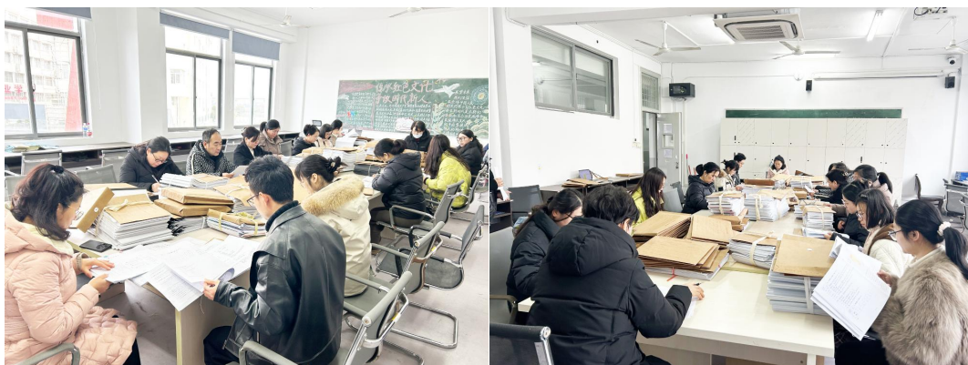
图1 学院检查小组认真检查试卷

为进一步规范教学管理，强化课程考核质量监控，促进试卷质量的持续提升，确保期末考试工作的科学性与严谨性，高质量迎接本科教育教学审核评估，服装工程学院于2025年2月18日下午13:30在主教学楼204教室开展了2024-2025第一学期期末考试试卷专项检查工作。学院领导、教研室主任、院督导和骨干教师参与了此项工作。